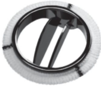
Rys. 3 Zastawka dwupłatkowa [8]