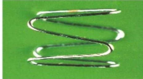
Rys. 9 Stent pierścieniowy [12]

W przypadku zwężenia naczyń krwionośnych w celu poprawy przepływu krwi można stosować stenty kardiologiczne, czyli spirale implantowane do zwężonej tętnicy w trakcie zabiegu angioplastyki, którą wprowadza się w celu poszerzenia światła naczyń krwionośnych. Wyróżnia się stenty samorozszerzające się wykonane z materiałów z pamięcią kształtu np. Nitinolu oraz stenty umieszczone w cewniku wraz z specjalnym balonikiem wykonane zwykle ze stali 316l. Pod względem budowy można wymienić stenty siateczkowe, rurkowe z nacięciem, w kształcie zwoju i pierścieniowe (Rys. 6-10). Najważniejszą cechą stentu jest jego atrombogenność, ponieważ powstanie skrzepów może doprowadzić do zamknięcia światła tętnicy. Jeśli materiał z którego wykonany jest stent nie wykazuje tej właściwości, pokrywa się go atrombogenicznymi powłokami np. fosforanowo wapniowymi lub węglowymi, które zapobiegają powstaniu skrzepów. Do innych wymagań należy odporność na działanie różnych ciśnień krwi, mały przekrój, odpowiednie rozmiary, elastyczność, brak zmiany przekroju przy rozciąganiu, odporność na zużycie, utrzymywanie drożności, stabilność wymiarową, biogodność, odporność na zakażenia, dostępność i łatwość implantacji [6,12].