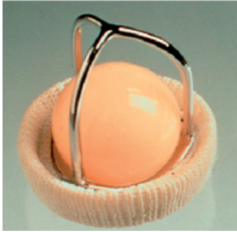
Rys. 1 Zastawka Edwarda Starka [8]