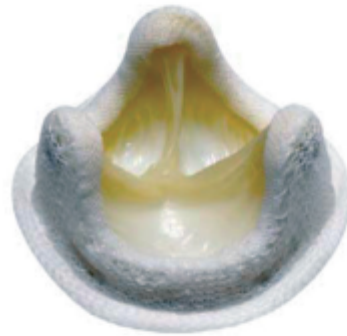
Rys. 4 Zastawka wieprzowa [8]