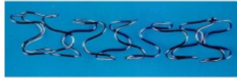
Rys. 7 Stent w kształcie zwoju [12]