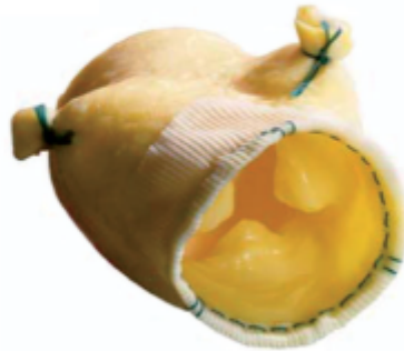
Rys. 5 Zastawka wołowa [8]