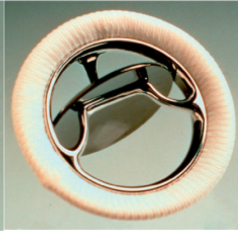
Rys. 2 Zastawka Bjorka-Shiley [8]