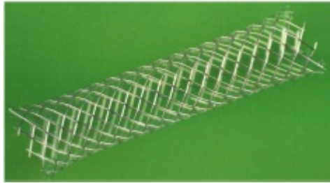
Rys. 6 Stent siateczkowy [12]