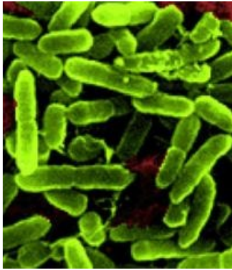
Zdjęcie: Pseudomonas aeruginosa [17] .