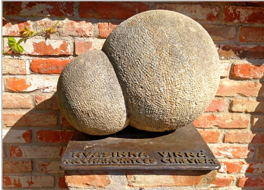
Ludzki hołd dla drożdży. Drożdże winne w czasie podziału, powiększenie prawie 70 000 razy. Hustopeče na Morawach.

Hamilton przyporządkował zachowania socjalne do czterech klas. Wyróżnia on: 1) współpracę, kiedy wszyscy odnoszą korzyść. Wynikiem zachowania jest zwiększona liczba potomków u wszystkich zaangażowanych osobników; 2) altruizm, kiedy w ostatecznym rozrachunku dawca będzie miał mniej, a biorca więcej potomstwa; 3) samolubstwo, kiedy dawca zwiększa swoje dostosowanie, czyli liczbę potomków, kosztem biorcy; 4) złośliwość, kiedy wszyscy tracą. Czyli zarówno dawca jak i biorca mają mniej potomstwa, chociaż nie koniecznie tracą tyle samo! Często „złośliwy” traci dużo mniej niż ofiara takiego zachowania. Warto dodać, że w tej klasyfikacji zachowań liczą się jedynie efekty interakcji. Nieistotne są (o ile w ogóle obecne): emocje, uczucia lub intencje.