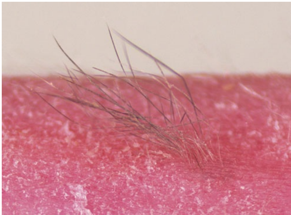
Fotografia 2: Skóra uzyskana z komórek macierzystych wraz z mieszkami owłosienia przeszczepiona na grzbiet myszy.

Po upływie miesiąca, zespół pod nadzorem Tsuji dokonał usunięcia komórek, w których znajdowały się trójwymiarowe cząsteczki skóry, wraz z połyskującym czarnym owłosieniem oraz różnorodnymi organami wchodzącymi w jej skład, w tym gruczołami łojowymi, które wydzielają substancję oleistą do nawilżania oraz impregnowania skóry oraz włosów.